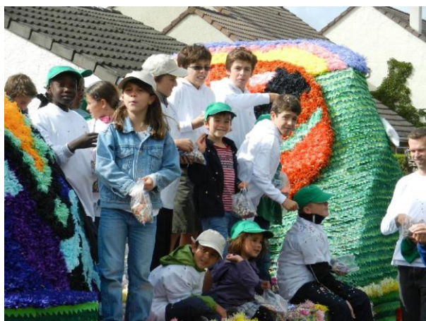
Les enfants lors du défilé de chars