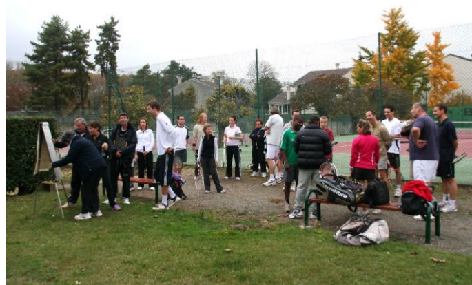
Lancement des matchs de double-surprise.

Si ce type d'animation vise en premier lieu les nouveaux venus, les anciens y sont naturellement bienvenus, et participent à l'accueil des nouveaux tout en en profitant pour eux-mêmes.