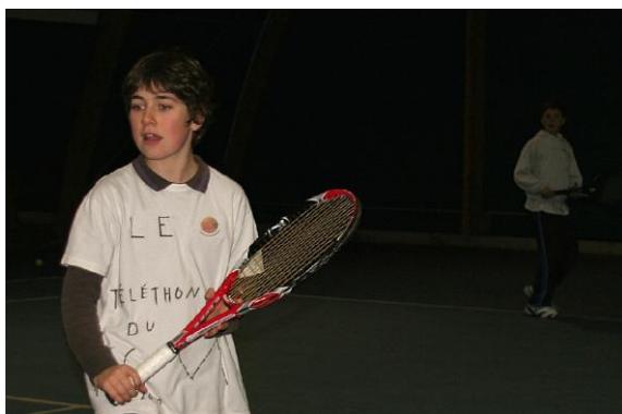
Les jeunes ont transpiré pour les enfants malades